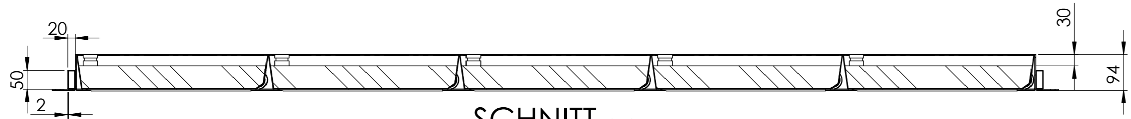
SCHNITT A-A MABSTAB 1 : 10